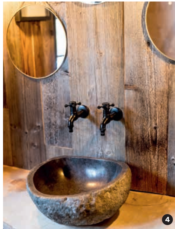
1. Binnen werd de chalet gestript en ingericht naar de nieuwste trends, met donkere keukenkasten en plafonds. 2. De lambrisering bestaat uit hergebruikte planken. De wat ruwe afwerking klopt met de sfeer van de omgeving. 3. Het vervoer van het tafelblad in emperadormarmer was geen sinecure. 4. Ruw en verfijnd tegelijk, deze mooie wastafel.